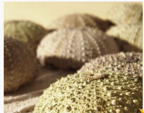
Chemin d'oursins (détail) - Ana MONTOYA

Bois du Jura, terrazzo en brocatelle, sculptures minérales ou végétales, œuvres textiles... 18 artisans, artistes et centres de formation révèlent au travers de leurs créations le processus créatif, de la matière brute à la pièce d'art. Un voyage au cœur du savoir-faire français !