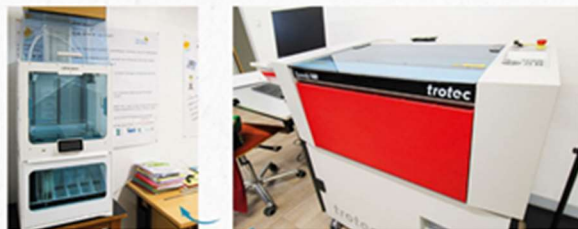
La nouvelle imprimante 3D et la découpe laser du fablab !

Au fablab deux imprimantes 3D, une machine de découpe et de gravure laser et un plotter ont été installés en attendant l'installation d'une brodeuse numérique.